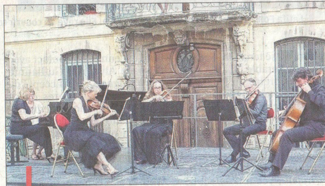
Chaque année depuis 6 ans, les mélomanes se délectent de "Musique aux étoiles".

■ Jeudi 17 juillet, sur le parvis de la Cathédrale Saint-Siffrein, à 19h30 , place au piano et au violon. Des sonorités extraordinaires de Pablo de Sarasate à Fritz Kreisler en passant par Josef Suk, élève d'Antonin Dvorák, répondront à des pages plus anciennes de Schubert ou Beethoven. Un spectacle éblouissant