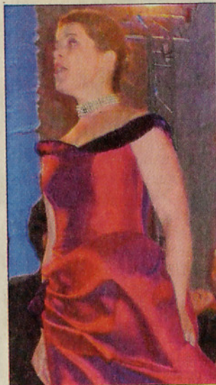
Tenor, baryton et soprano ont magnifiquement interprété les œuvres.